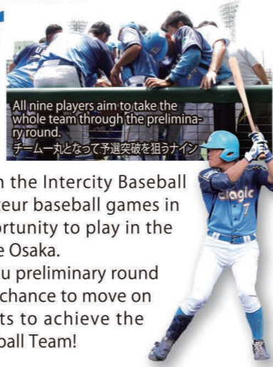
All nine players aim to take the whole team through the preliminary round. チーム一丸となって予選突破を狙うナイン

エナジック硬式野球部も9月5日開始の九州地区予選に参加し、まずホンダ熊本と対戦することになりました。この予選には15チームが参加し、うち2チームだけが本大会に出場できます。エナジック硬式野球部は念願の全国大会出場をめざし奮闘しています。みんなで応援しましょう!