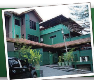
The training center opened in July. 7月にオープンしたトレーニングセンター